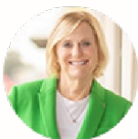
STACY M. BUTTERFIELD, CPA Clerk of the Circuit Court & Comptroller Polk County, Florida

*Cargos por pagos atrasados pueden aplicar, si es necesario. **Un cargo de 3.5% por procesar su tarjeta de crédito es aplicable. ***Los clientes deben de pagar su multa en el condado que la recibieron. Las oficinas de los Secretarios de la Corte estarán participando en este evento en todo el estado. Visite flclerks.com/page/GreenLight para más detalles